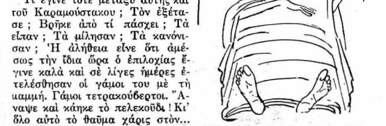
Έστώλιε με άνθη το κρεβάτι, φόρεσε και το φέσι του.