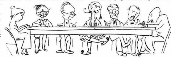
Την καλούσε με τις άλλες Άρχες προς σύσκεπνιν.