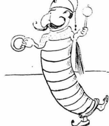
Έτσι μούχεχαι να γίνω βρέφος!

— Ήπιλοχίας τόνιν ηρώσον, σ' λείε ού άλλους, κι να σι παρφορνεί!... Το' πηρι ού δίδουλος τόνιν παπ'λάκη, το' πηρι!... Κι γιατί ούδρέ; Μήπως μού τα δώσαν χάρισμα,