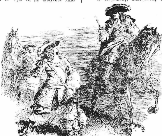
— Στάσου, άθλιε, άλλωθως σου σκορπίζω τὰ μυαλά! φώναζε ὁ Φερουλλιάζ.

— Βεβαίως έρωλε να μου τὰ πῆς, ούρλιαζε ὁ λοχαγός. Μόνον που άρωγες να τὸ σκεφθῆς. Έρωλε να μου φέρης έμένα τὸ καθότιο και τ' άλλα πράγματα αιτού του άθλιου. Μά δ,τι έγινε έγινε πειά. Ποιό δρόμο είπες πως πήρε ὁ νεοφώτιστος Ισπότης; — Τράβηξε κατά τὸ χτήμα του Ούγολινου, κίριε.