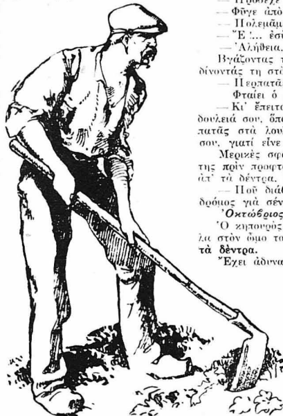
Κροκόντας ένα τασι σκύνει και στρούει τ' ο χώμα...