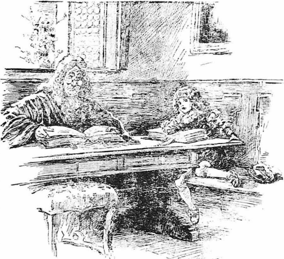
Άρκετά τις μελιές κ' είχε κοντά του τους καλύτερους δασκάλους...

Ήταν όμως πολύ άποφασιστική γυναίκα ή χήρα αυτή. Μόλις ή πληρές της έλκισαν, ξεκίνησε περβή, χωρίς ειχε άπεί, και έπειτα από είκοσι ήμερών δρόμο, έφτασε τέλος στην προτεύουσα. Παρουσιάστηκε τότε στον Ίακώβο Α', έπασε στα πόδια του και τού διηγήθηκε με δά-