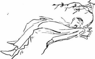
Ένας άνθρωπος κατίετο ίκίη ψυχωκαχόντας!