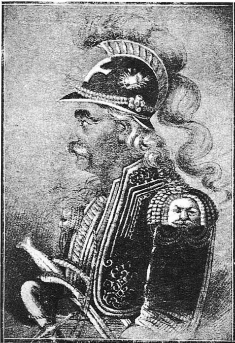
Ὁ Θεόδωρος Κολοκοτρώνης (Σπανία παλαιὰ λιθογραφία)

ΣΤΟ ΠΡΟΣΕΧΕΣ : Ἡ συνάντησί μου μὲ τὸν Κολοκοτρώνη, κλπ.