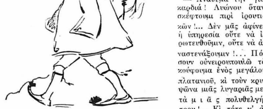
Περπατούσε σκυφτός, βουδός, μελαγχολικός...

— Ανάθεμά την για κωδιά! Άνώνου όταν σέφετομυ περί ήρωτικών! Δέν μάς άφίρει ή υπηρεσία ούτε να ήρωτεψθούμ, ούτε να άναστενάξομιν!... Πόσοσιν ονειρευοταιλά το κούφωμα ένός μεγάλου πλατανιού, κί τούν κρυφώνα μιάς λυγαριάς μετά μι ι α ς πολυθελήτρον!... Κί τότε ν' άκουσής άναστεναγμούς, όχι σάν ίνός βοϊδιού