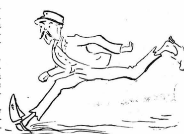
Ο άγροφύλακας τρέχοντας σάν παλαδός, χωρίς τουφέκι!...