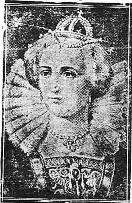
Η Βασίλισσα 'Ελισσαβέτ

— Θεέ, εταπλαχύνον τόν τυχερό σου δοίλο ! — 'Επειτα, άποκηνώτας τού κεφάλι τού στο κοίτωρο, έναμώναξε : — Θεέ, σού παραδίδο τού πνεύμα μου !... Έλακοιούθησαν λίγες στιγμές άπόλυτης σιωπής, αγάνστα δοματιστά, και έξαφα ο μαρμειμένος κόμοις, με ένα άνατοχισμόμα φροίσης, ειλε τόν κόμητα ν' άπλωνη τή χείρα τού. Ήταν τού συμφωνημένο σημάδι. Ο δήμος σίμωσε τότε τού πείλα τού, τού στωφογίσος και τού κατάρφες στον λαμό τού 'Εσσεξ. Έτσι πέθανε ο περηνόμο και μεγαλόψυχος αυτός νέος. *