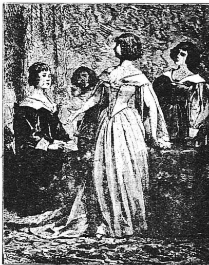
'Η Μαρκησία άρχισε να διηγήται την έρωτική περιπέτεια του Ρισελιέ...

Μια μέρα, έπειτα από τον θάνατο του Ρισελιέ, η όποια μαρκεσία ντε Σαιν-Πιέρ βρισκόταν σε μια συντροφιά, δτιν όποια γινότανε λόγος γ' αυτόν. "Όλοι ήταν