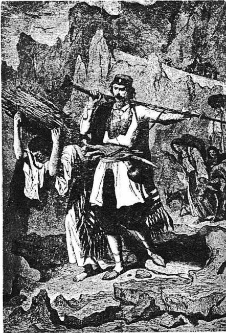
Χωρικοί τοῦ Μωρηῶ (Εἰκὼν ξένου περιηγητοῦ)