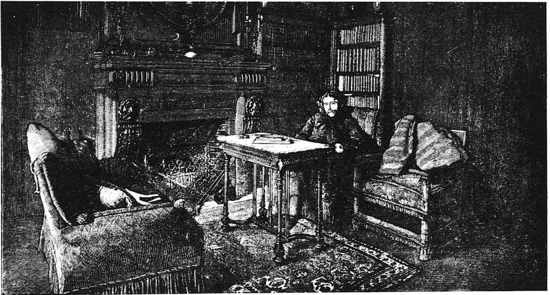
Ο Άλφόνσος Δωδέ στο γραφείο του, κατά τα τελευταία χρόνια της ζωής του.