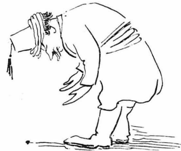
Κοιμωσιόστηκαν στους τεμενές

Αιτία όλου του κακού αυτού, ήταν φυσικά ο Παλμέτης. Κροχημένος στο «Βαθειά Χαράσια», έκει κοντά στον Στροφιμώνα, παραφύλαγε ημέρες, μήνες, νύχτες κι' αυτές, κι' όταν περνούσαν ένας ή δύο Τούρκοι, τους εσκότονε κι' έπειτα τους κοιβαλούσε στον κότερασιανό τον λόζκο και τους γκρέμιζε κάτω μαζί με τ' άλλα τους και τα πράγματα, για νά μη μείνη ίχνος απ' αυτούς και βρούνε το μυστήριο οι Τούρκοι.