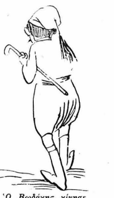
'Ο Βοδάκης κίνησε νά πάη νά τó φέρη!...