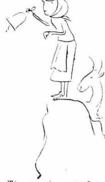
Το κορίτσα χτυπούσε το κουδούνι.

Σινέγρια και τέλος! Κάθε μέρα λοιπόν και ένας ή δύο Τούρκοι από τα γύρω του 'Ηρακλείου, ή από τα χωριά της Μεσοασίας, χανόντουσαν κι αυτοί και τ' άλλα τους και τα πράγματά τους, ενώ πήγαιναν στη δουλειά τους.