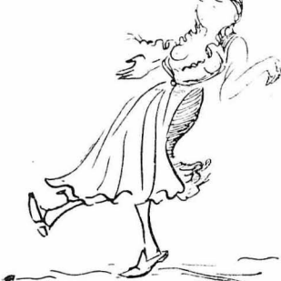
Νά χορεύουνε μ' άνοιχτά στήθη!...

Έτσι τó κουδούνι τού θανάτου χτυπούσε για τους Τούρκους άρεκτό καιρό, ώς που έγινε ή μεγάλη επανάσταση και σκρόθηκε πειά όλος ο κόσμος στό πόδι.