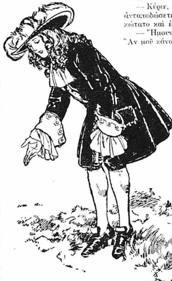
— Νά ή αίτια όλου τού κακού! εινε άτάραχα ο Ρογήςος.