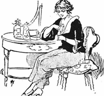
Στολίζον πάντα μὲ λευκὰ τριαντάφυλλα γιὰ νὰ τὸν θυμάται πάντα...