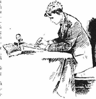
Κλεινότανε στο δωμάτιό του, και έκει έγραφε στίχους και άνειροπολούσε...