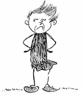
— 'Ηθεσ άπ' την 'Αμερική και λέξ έλο «γυιές» !..

Σύμφωνα με μι' στατιστική οι κάτοικοι τού Παρισιοϋ τρώνε κάθε χρόνο 266.800 βάρδια, 216.300 μοσχάρια, 1.722.000 πρόβατα και 257.500 χοίρους.