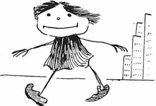
Της Νέας 'Υόρκης τ'α μαγκόπαιδα τού μπαίνανε στη μύτη.

Κι' ανταπάντησε : — «...Τίποτα από αυτά. Πρέπει να ρθή 'Αμερικάνος. Μετανάστης