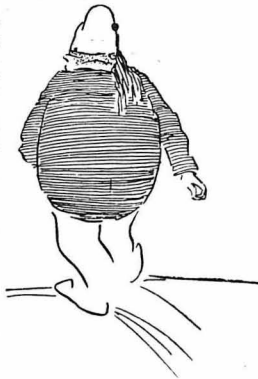
Θά έλθη Τζωρτζ Πάιπες και όχι πλέον Γιώργος Παπαρούνας.