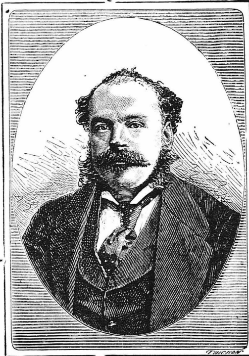
Ο Φρανσουά Βικτωρος Ουγκώ, υἱὸς τοῦ μεγάλου συγγραφέως, γνωστὸς γὰ τὴν μετάφρασι τοῦ ἔργου τοῦ Σαίξπηρ.

Π. γ. τὰ τοιγάρ, κατὰ τὴν διάρκεια τοῦ γεύματος, ἀποτελοῦν... κοινὸν κτήμα.