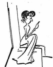
— Νοικοκυρούλα δέ να γίνης ζηλευτή, σ' Άμερική κ' Έδωστη !