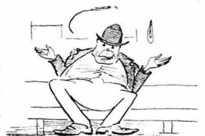
Έργήνης και άνυπαντες !