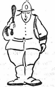
Άκίνητοι σαν σημάδοφρες !...