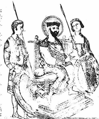
Βυζαντινός Αυτοκράτωρ. (Εικόνη Βυζαντινού χειρογράφου)