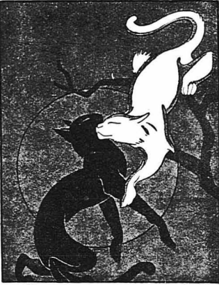
Νυκτερινό Ειδύλλιο !... !