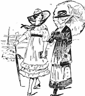
Πήγαινε εις τ'ό κοντινό χωριό, πάντα συνοδευόμενη από τη θεία της...