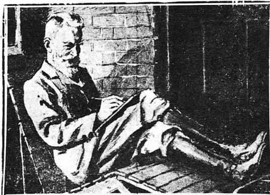
Ο Μλέναγ Σόου

— Α ! όχι ! κρηια μου ! τής άπάντησε ό Κοκπέ, όταν έπήγε και σ' αυτόν. Έκράτησα άλλοτε τού λόγο που σας είμα δόσει και κρηισα τού σφουόνου σας... Ο σφουόνος σας όμως δεν έκράτησε τού δικού του... Γιατί δεν... έπεθανε, όσος με βεβαιώνετε ότι θα σιμθί, άν δεν έκλεγη ακαδημαϊκός ;