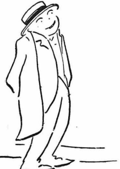
'Ἐγέλασαν οἱ μετανάστες μὲ τὴν ἱστορία αὐτὴ ἀρεκέτᾳ.

Σὲ μιά γωνιά τοῦ βατοριοῦ, ἦταν πλῆθος ἀπὸ παιδάκια 5—12 ἐτῶν, πὼ μετεφέροντο σὴν κατσιάκια στὴν 'Αμερικὴ, γιὰ δουλειά. 'Ἦσαν μαζεμένα στὴν ἄρχη καὶ χαροῦμενα, γιατί θὰ πᾶν νὰ ἴδωιν κι' ἄλλον κόσμο. 'Ανακατωμένα ἔκει πέρα μὲ τὰ ροῦχα τοὺς, τὰ εστιάκια τοὺς, τὰ πορτοκάλια πὼ εἶχαν μαζῶ γιὰ τὴ ναυτία, τὶς φλουδὲς πὼ πετοῦσαν ὀπλά τοὺς, τὰ καπέλλα τοὺς, τοὺς ξηροὺς βασιλικούς, πὼ τοὺς ἔδωκαν ἡ μάνες τοὺς γιὰ νὰ μωρῶζονται, τὶς βγαλμένες κάλτσες τοὺς, τὰ πόδια τοὺς, τ' ἀκούρευτα μαλλιά τοὺς, τὴν κατάντια τοὺς καὶ τὴν ἀβλιότητά τοὺς, ἦταν λυτὴ καὶ σαταραγμὸς νὰ τὰ βλέπης.