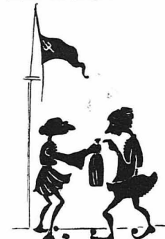
— Μι τὰ λιφτά μου !...

Την επομένη, το ζήτημα τής ημέρας στο βατόρι, ήταν η έκπορική επιχείρησης δυο μεταναστών. Πριν κινήσουν από το χωριό τους σκέφτηκαν ότι μπορούσαν κάτι να κερδίσουν στο ταξίδι.