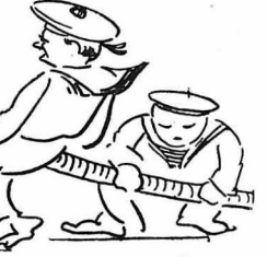
'Η τρέμτες δουλεύαν ἀτελείωτα.