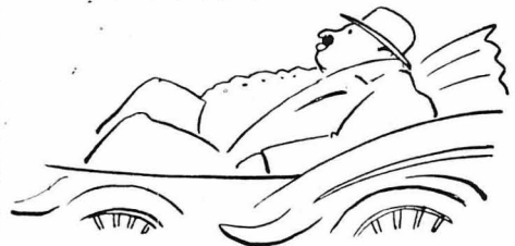
Οι μεγάλοι τραπεζίτες.