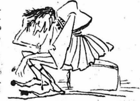
Κλαίει κι' ο Νεαροβήμος!...

— Αμερική την είπανε, κι' Α-μερική είνε, που καιζό ζρόνο νά-ζη!... είπε ένα κίτρον άδύνατο παιδί, που καθόταν σ'ή μι άζρη, με σηκωμένο τόν γαζιά. — Αηλιάδ; τόν ρώτησε ο δά-σκαλος. — Πίρακα και φρατζαζία. Τ'ο λέει και τ'ο όνομα: 'Α μ ε ρ ο ζ ή ή, από τ'ο 'Α μ ε ρ ο που λένε και ο Γάλλοι, δηλαδή πικρό!... — Και σ'ό τί ήσανα, που ξε-