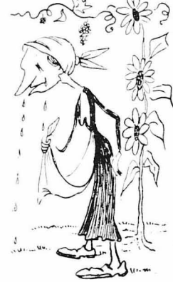
— 'Εξέλαινε η Μαστρογιάννεια ;

αλόζιλος ο Ειρηνικός Ώκεανός, θά σονόντουσαν, θά ξερονότανε!... Τ'ο Κράτος, βρέ, είμαστε ημείς!... Καί όλοις τρώει από τ'ο Κράτος είνε σ'άν νά τρώη τόν ίδιο τόν έαυτό του, σ'άν νά τρέφεται από τ'ο ίδια του τὰ ζρέατα.