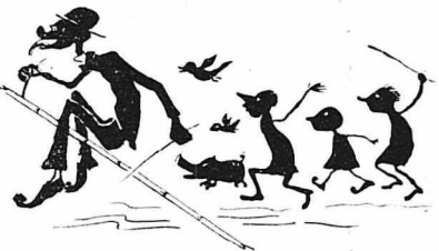
— Και νά τεθή επί κεφαλής επαναστάσεως.