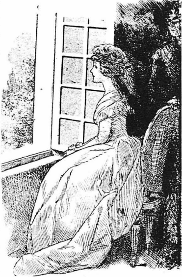
— Σας περιμένε πάντα, πάντα σας σκεφτότανε, πάντα σας όνειροπολούσε...

— Το βρισκο άξιαγάτητο, άπάντησε ό ίποζομης. — Μη τό λές αυτό δυνατό, Ρογήρο!... Αυτός ό μικρός που βλέπει εδω με τό άρελέξ υφρος καί με τά μεγάλα άδολα μάτια, είνε ό χειρότερος γνωκαθής που μορεις νά φαντασθής. (Ακόλουθει).