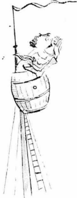
— Ν' ἀνεβάσουμε ἓνα ναυτὸ στὸ κατάρτι νὰ φωνάξῃ.

Τοῦς πῆρε ἔπειτα στὴν πρόση καὶ τοῦς ἔδειχνε τὸ βῆθος τοῦ ὀ- ριζόντος: — Νά, βλέπετε ἐκεῖ κάτω τὴ στεριά; Ἢ πουθενά δὲν φαινόταν, ἀλλὰ ὁ καπετάνιος ὄλο καὶ ἐπέμεινε. Ἄλ- λιώστε ἦσαν καὶ κἀπὶ σύννεφα στὸ βῆθος, χαμηλά... — Νά, βλέπετε ἐκεῖ κάτω τὴ στεριά; — Ὅχι. — Βρέ, δὲν τὸ βλέπετε κοντιὰ βουνοῦ, κ'εῖ κάτω! — Ὅχι, δὲν τὸ βλέπουμε! — Ἐιστε καλὰ ἢ στραβωθίκατε; Ἐνα βουνοῦ θηριο, δὲν τὸ βλέπετε; — Καλὰ λέει, ὁ καπετάνιος, κἀπὶ φαίνεται. — Ναι, φαίνεται ἓνα βουνοῦ. — Καὶ τί ψηλό, μορὲ παιδιὰ! — Μὴν εἰν', κί' ὁ καπετάνιο, ἢ Ἀθήνα; — Αἱ ἄλλες εἶνε! διέκοψε ὁ δάσκαλος.