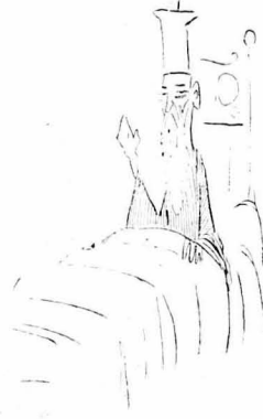
Ὁ Παπαντράκλας τ' ἀφῆσε κατὰρ καὶ εὐχῆ.

— Ὅσιτε σὺ νὰ κυβερνήσεις τὸ λοιπὸς, εἶπε ὁ καπετά- νιος στὸ Γέω—Μάνθο, πού φωνάζε ἀπὸ τοῦς ἄλλους δυνα- τώτερα.