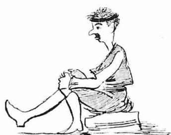
— Ἐτοιμος εἶμαι νὰ γυρίσω, εἶπε καὶ ἓνας Κρητικὸς.