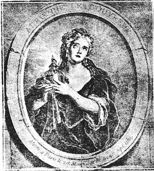
Η Άδριανή Λεκουβρέρ

Όλοι οι φίλοι της τότε έμειναν σήμωνοι, ότι ο άββας έπρεπε να προσοπιηθεί πως παίζει το