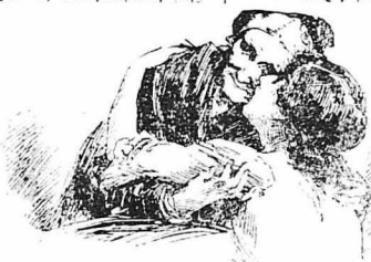
Πυγμένη από συγχήσιση άγκάλιασε τή γορή μητέρα τής και τή φίλησε...