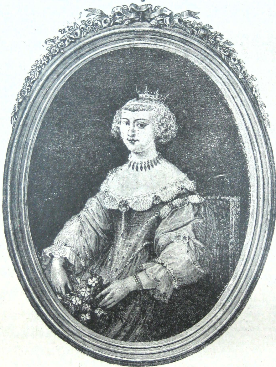
Ἡ περίφημη Γαλλίς λογία Μαντὰμ ντε Δογκαβίλ.