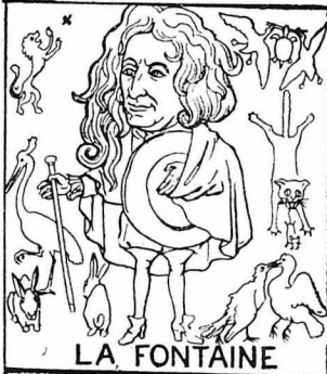
Ὁ Γάλλος μυθογράφος Λαφοντεῖν

νὰ ἀκούσιν λίγη μουσική. Ἐπίσης καὶ ὁ διάσημος ἐκπατοῦς Μουσταλιῶ πρὶν ἐταμίσει τὸ λόγο του σινηθίξε νὰ πᾶξῃ στὸ βιολί του ἕνα μουσικὸ κομμάτι.