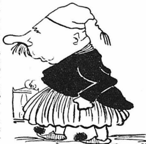
Τό πήξε τού γειτονικού χωριού ο Διμαρχος