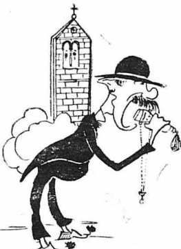
"Έφαγε όλα τά καντήλια από τις εκκλησίες.

Και τό φεγγάρι από πάνω, όλο έκλαιγε - έκλαιγε, σταλίζοντας στη θάλασσα τά άργυρά, τά άσημένα