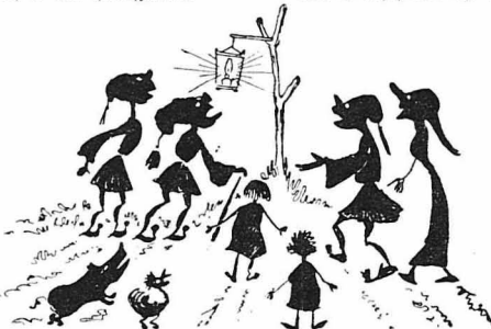
Μαζεύτεκε όλο τό χωριό για νά θανατάσει τό φανάρι.

ώργος. "Ακοιμισμένοι έτοι, στίς μεγάλες κουλούρες τών τριχιών τού βαποριού, συζητούσαν ώρα πολλή. "Έλεγαν για τά χωριά τους, έλεγαν για τά σιτάρια, τις σταφίδες, τά βόδια, τόν Διμαρχο. Τόν διμαρχο πού έφαγε και τό καντήλι της εκκλησίας άκόμα και όμως όλο και τόν ψηφίζον. Φανάρι μιά φανάρι, ποτέ τού ο χαντακουμένος, δέν τούς άναψε. Κάργο για τό σκουπίδια στίους δρόμους δέν βγήκε ποτέ. Και όμως κάθε τετραετία έβγαυε διμαρχος !