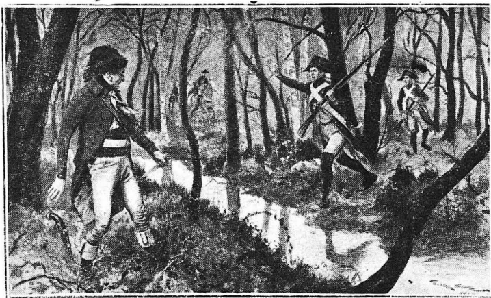
Η σύλληψις του Μονεζ

— Έλεος, κόψε, τόν έκέλευσε η κ. Λεόν. Δέν έχουμε πειά τά χουμάτα αυτά, μιά έχουμε άκόμα λίγα χουμάτα δικά μας, άσημα, κωμμάτα... Πάρτε τα !.. Όλα είνε δικά σας... Μιά χωρίστε μας τη ζωή !..