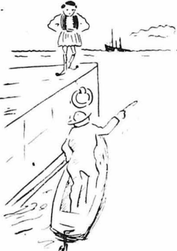
Βαρκάρης εἶσαι ἐλόγου σοῦ ἡ λοποδύτης ;