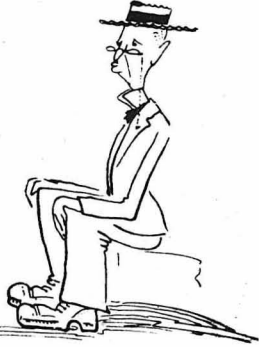
Ἐ φ θ ᾶ, παρακαλῶ !