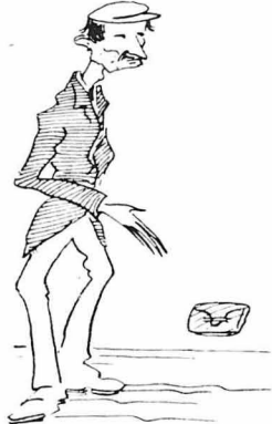
Τοῦ πέταξαν ἓνα πορτοφόλι.

Ο Γιώργος τάδε ουσίσει... Τὴν Παναγία τὴ δική του τὴν φανταζότανε μὲ κατὶ τὸ φτωχό. τὸ ἄγνο, τὸ σερνο καὶ τὸ καλοκαρδῶ, μὲ κατὶ σὺν τοῦ σπιτιοῦ του τὴν ἀπλότητα καὶ σὺν τῆς 'Ανθοῦλας τῆς δροσιά καὶ τῆς μητέρας του τῆς ζέστα. Ἐκεῖνη ἡ γυναίκα, ποὺ ποζαρισμένη καὶ σπολισμένη μερσοτά του ἐστεκότανε, δὲν ἦταν βέβαια ἡ ἀληθινὴ ἡ Παναγία, ὅπως τοῦ Φιλίππα ἡ γυναίκα, δὲν ἦταν ἡ γυναίκα ποὺ αὐτὸς ονειρευότανε.