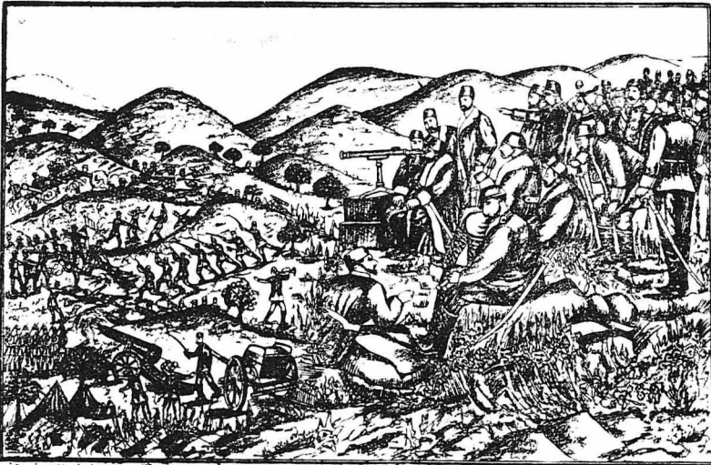
Η μάχη του Τυρνάβου (Εικόνα Τουρκικής εφημερίδος τής έποχής)

Έξαντλημένοι οι Τουρκοί είχαν να κα- ταλυσθή στίς θέσεις που κατείχαν προ- τής μάχης. Πρώτα- τα σκέπταν τόν κά- μπο και σμήνη κορ- κων πετοίμων πάνω άτ' αυτά.