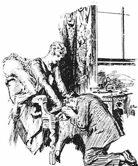
Πάντα ροιμανένος μπροστά της, δούλος και λάτρης της...

—Πόσο είμαι εύτυχισμένος, που δεν έρω πια να κάω τίποτε!...»