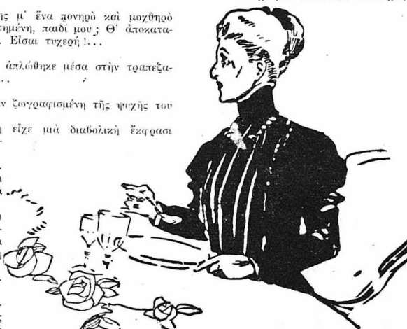
Η μητέρα της είχε άπομείνει μέ τό κουτάλι στό χέρι...

μόνο για να εκδικηθή. Μά σου τούτα, καμιά, δέν θα ύποκινήω κα' άν πρόκειται να με κάνη κομμάτια. ... Θά φύγω... Θά παντρωτόν "Άνδρα, κα' άς χαλάση ύστερα ό κόσμος! "Αν μου πής όχι, άν μου άρνηθής, θα πής πώς δέν μ' αγαπάς. Θές να παντρωτόν έναν άνδρα που δέν τόν γνωρίζω, δέν τόν αγαπώ, που τόν μισώ, ναί, τόν μισώ, χωρίς να τόν ξέρω;