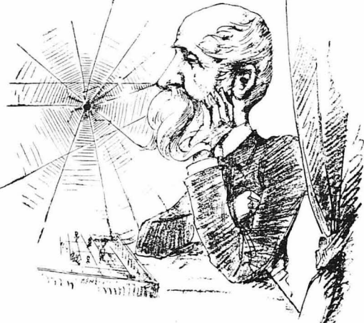
Ὁ Θεῶν Δελιγιάνης (Γελοιογραφία τοῦ Θ. Ἀννίου στὸ «Ἄστυ»)

Στὸ «Ἄστυ» ἡ Μοῦσα τοῦ Σοφῆ λέει μετὰ τῆς φρεσύνου τῆς γενιῆς τῆς. Ἴδου π. γ. τὸ «Μετρησι»: Παλεύοντι τὰ κόμματα, μοναχίζοντι τὴν θεοῖα βελίζοντι τὰ πρόβητα καὶ πᾶν ἔδω (κ' ἐκεῖ), τὸ ἓνα κόμμα βραζει δὴ, τὰ δύο (ἐβράζον τοῖς, καὶ ὄχι τὰ μίσημα κ' ἢ ἀσθ-μητικῆ). Μιτρά καὶ ὁ Χαρίλαος, μετρά κ' ὁ μετρώ κ' οἱ δύο στὰ δαχτυλά καὶ (χάσκου σὰν χαζοί, κ' ὁ Παπαμαχαλοπούλους, ὁ φοβιτῶς (σοσιάνης