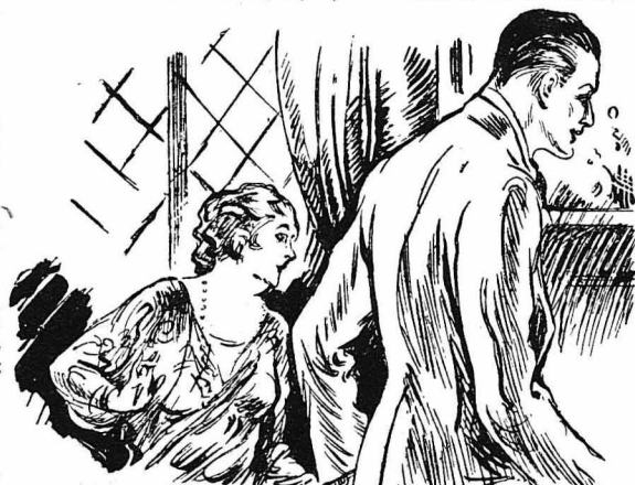
Ὁ Ἄνδρας πηλοῖσσε στὸ κρεβάτι τής αγαπημένης του, γεμάτος συγκίνηση...