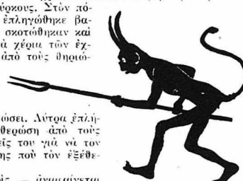
Πρώτος απ' όλους ο αρχιδιάβολος με το δικριόν του !...