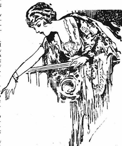
Τούφριχνε μικρά σημάδια από τó μαλακόν της...