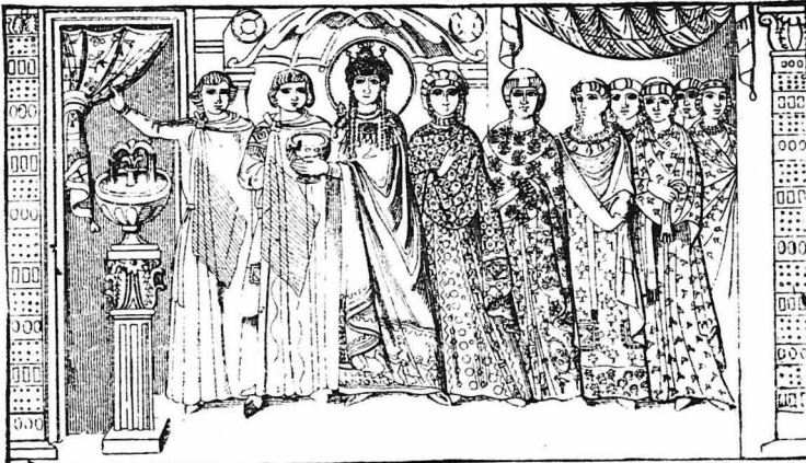
'Η Θεοδώρα, όταν έγινε αυτοκράτειρα, με τήν άκολουθία της (Ψηφιδωτό τής Ροβένας)

— Πάρτο, μητέρα. Εινε τό δόντι τού Λάμα, τού μεγάλου μαθη-τού τού Βούδδα!