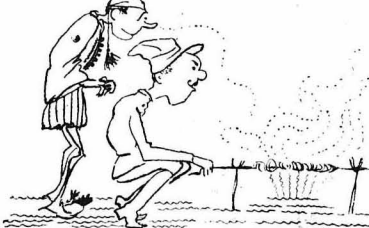
Άνεύλαθε μάλιστα μόνος του να τό ψήση...