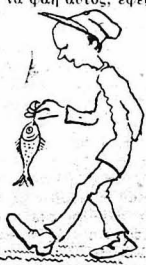
Ό εφοδισμός τού στρατού ήτανε μιά εγγύα...