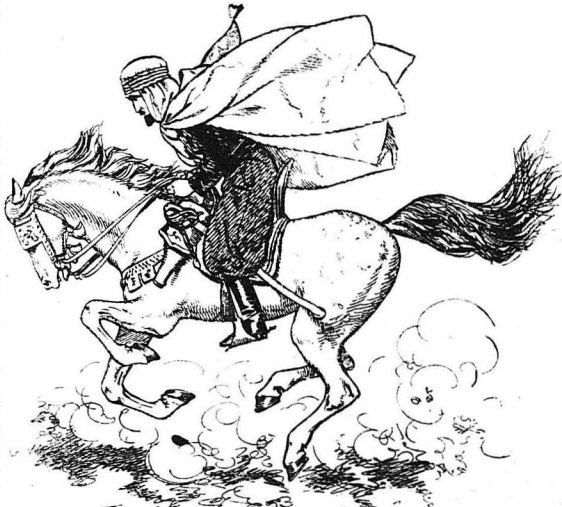
Τρομερός, άκράτητος, άμειοφής...