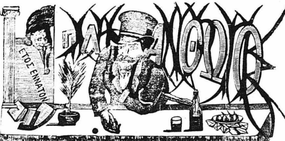
Ο τίτλος της εφημερίδος «Παληανθρώπου», με το οποίο τον Βεργέρη, έχοντας έμφοβό τον ένα καλαμάρι και μία μπου

Χθές διεήχθη ενώπιον του Ειρηνοδικείου της βορείου πλευ