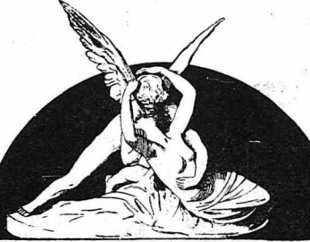
Έρωσ και Ψυχή