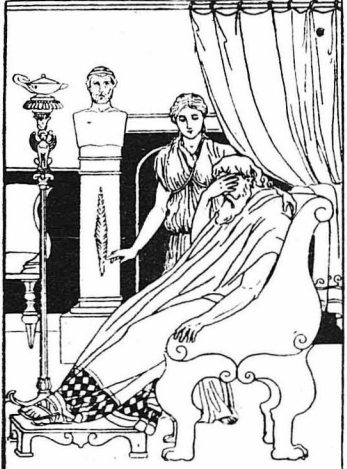
Ο Ζεύς, ο Πατήρ τών Θεών, ύποφραγει από... πονοκέφαλο !...

Οι νευροπαθείς της αρχαίας Έλληνικής μυθολογίας άποτελούν κομπολόι ολόκληρο. Νευροπαθείς ήταν, έξεφαρα ο Πολυφόντης, ο όποιος ειχε έρωτευτ ήν άρχουδα και άπόχτησε μαζί της δύο παιδιά ! Νευροπαθείς ήταν και ή Παισιφή, ή γυ-