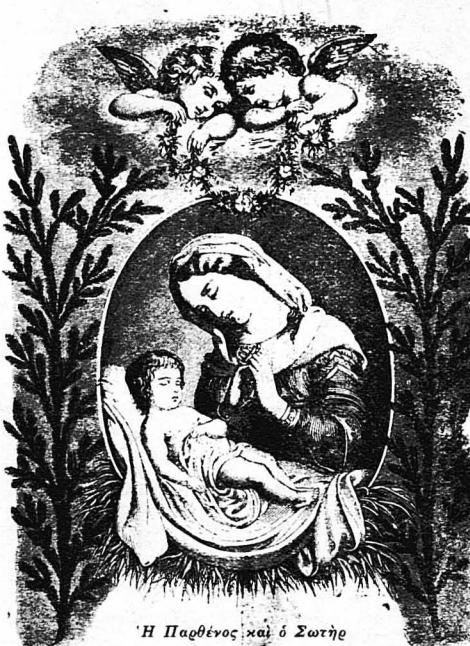
Η Παρθένος και ο Σωτήρ

Την κολισαύρα την ονομάζονε και Μαρία, για το χατήρι της Παναγίας, γιατί ή Παναγία την αγαπάει ιδιαίτερος, που έπαισε τόν κόσμο.