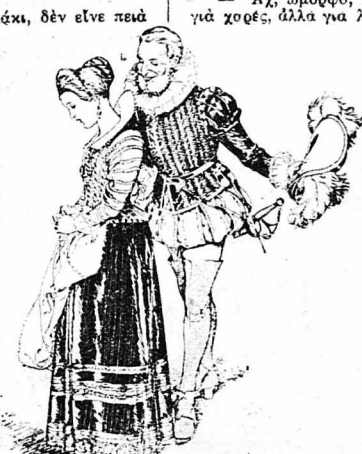
Ἁ βασιλιᾶς ἄρχισε νὰ τὴν κοροιδεῖ...