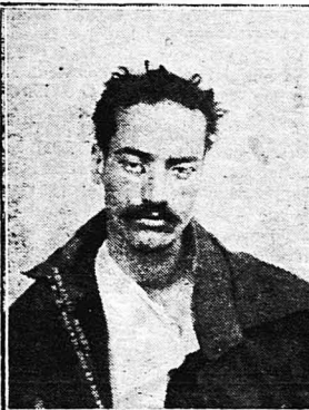
Χαιοσποτής πάσχων από μελαγχολία

Ό διάσημος φυσιολόγος και ψυχολόγος Ν. Λάνζ, ό όποιος για νά μελετήσει τήν επίδρασι του χαοσί έκανε διάφορα πείραματα στον ίδιο τον έαυτό του, αναφέρει όσα, άφού έληξε 30 έκατοστογράμμια χαοσί, ύστερ' από δέκα λεπτά έννοωσε μιά περίεργη κατάσταση φουσιής και ψυχικής μακαριότητος. Τού φαίνονταν πως ή φουσιές του δυνάμεις είχαν γίνει τεράστιες. Έν τούτοις του ήταν πολύ δδνητό να κινή μιά κίνησι προς μιά καθορισμένη διεύθυνσι ή να συγκεντρώσει τήν προσοχή του σ' ένα όρισμένο άντικείμενο.