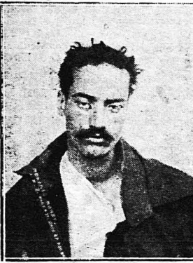
Χαιοσπότης πάσχων από μελαγχολία

Ό διάσημος φυσιολόγος και ψυχολόγος Ν. Λάνζ, ό όποιος για να μελετήση τήν επίδραση του χαοσί έκανε διάφορα πειράματα στον ίδιο τόν έαυτό του, αναφέρει όσα, άφού έληξε 30 έκατοστογράμμα χαοσί, ύστερ' από δέκα λεπτά έννοωσε μιά περίεργη κατάσταση φυσικής και ψυχικής μακαριότητος. Τού φαίνονταν πως ή φυσικώς του δυνάμεις είχαν γίνει νερόσιες. Έν τούτοις του ήταν πολύ δδνηγό νό κνήμη μιά κίνησι προς μιά καθορισμένη διεύθυνση ή να συγρητοφήση τήν προσοχή του σ' ένα όρισμένο άντικείμενο.