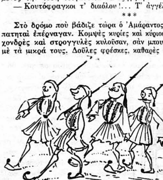
— Μωρέ παιδιά, μωρέ αδέρφια !

με τρομπόνα !... Χλωμός, αδύνατος και παραμελημένος τώρα, με τή φουόντα κρημασμένη εμπρός και κινουμένη σάν αλογονορά, σερόταν στο άδριο αυτός, πού πατούσε άλλοτε κι' έτρωζε ο τάπος !... Οι κύκλοι των δουλικών και των τροφών έθροβήθησαν.