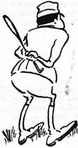
— Ούργανωματής, μάτια μου!