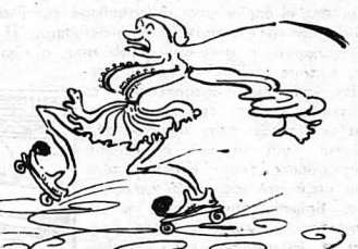
Και άλλοτε τον εϊδανε να κάνη πατινάξ