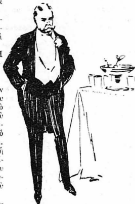
Ἄρχισε νὰ βηματῆ σκεπτικῶς στὸ δωμάτιο του...