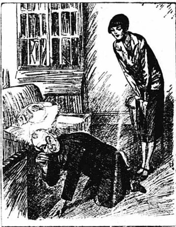
Το βράδυ, πριν κοιμηθῆ, έγαχε κάτω άπό όλα τά έπιπλα !...

Εκείνος τον ύποδέχτηκε με άκρα φιλοφρόνησι και τόν έβαλε νά καθήση σ' ένα καναπέ, στον όποιο ο έμπρος έπρεσε κατάζοπος, μίν ξεφροντας από πού ν' άρχισή. Τέλος κατόρθωσε νά πη : — Κύριε διεθυντά !... — Έπιταρος, προχωρήστε, κύριε μου. Τι τρέζει ; — Νά, σήμερα τό πρωί έλαβα αυτό τό δελτάριο... Κι έδειξε τό τρομερό γαλάζιο δελτάριο, πού τό κρατούσε με προσήλασι στην άκρη των δακτύλων του, σάν νά ήταν φοβίγιο δυναμιτίδου.