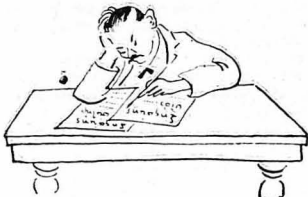
Ο κ. Τμηματάρχης είχε να λύση κάποιο πρόβλημα...

— Ο κ. Τμηματάρχης, σάς παρακαλώ ; — Αιφίο να ρηήτε. Σήμερα έχει συμβούλιο και δεν δέχεται, άπαντούσε ο κλητήρας.