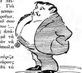
Είπαμε, κύριοι, ο κ. Τμηματάρχης έχει σήμερα συμβούλιο.

Τό λογικό τελειοποιείται, τό ύστιστικό μένει άμετάβλητο. Μπρόσέβ