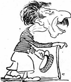
Άλλοίμονό μου, κ' έρχομαι από τούς Καπουτζήδες...

— Έλα τότε τήν άλλη βδομάδα ! Ο Τμηματάρχης από μέσα είχε σπλήνει και πάλιν στά χαιτιά του. Τό