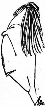
Η κυρία Κλυταμνήστρα