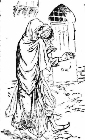
Πολλές φορές ο ίδιος ο σύζυγος οδηγεί την Χανούμ στο Σουλτάνο!

«Ο γιός μου, έλεγε, ένθουσιάζεταν όταν βλέπει Ειρωποιούς. Βέβαια, νομίζε ότι οι Ειρωποιόι, σε μια κρίσιμη στιγμή, θά είνε με το μέρος του. Έγώ όμως θεωρώ κάθε ξένο, έχθρο!...»