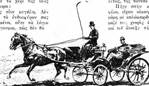
Πήδησε σ' έν' άμαξί και τράβηξε για το σπίτι του ζωγράφου...